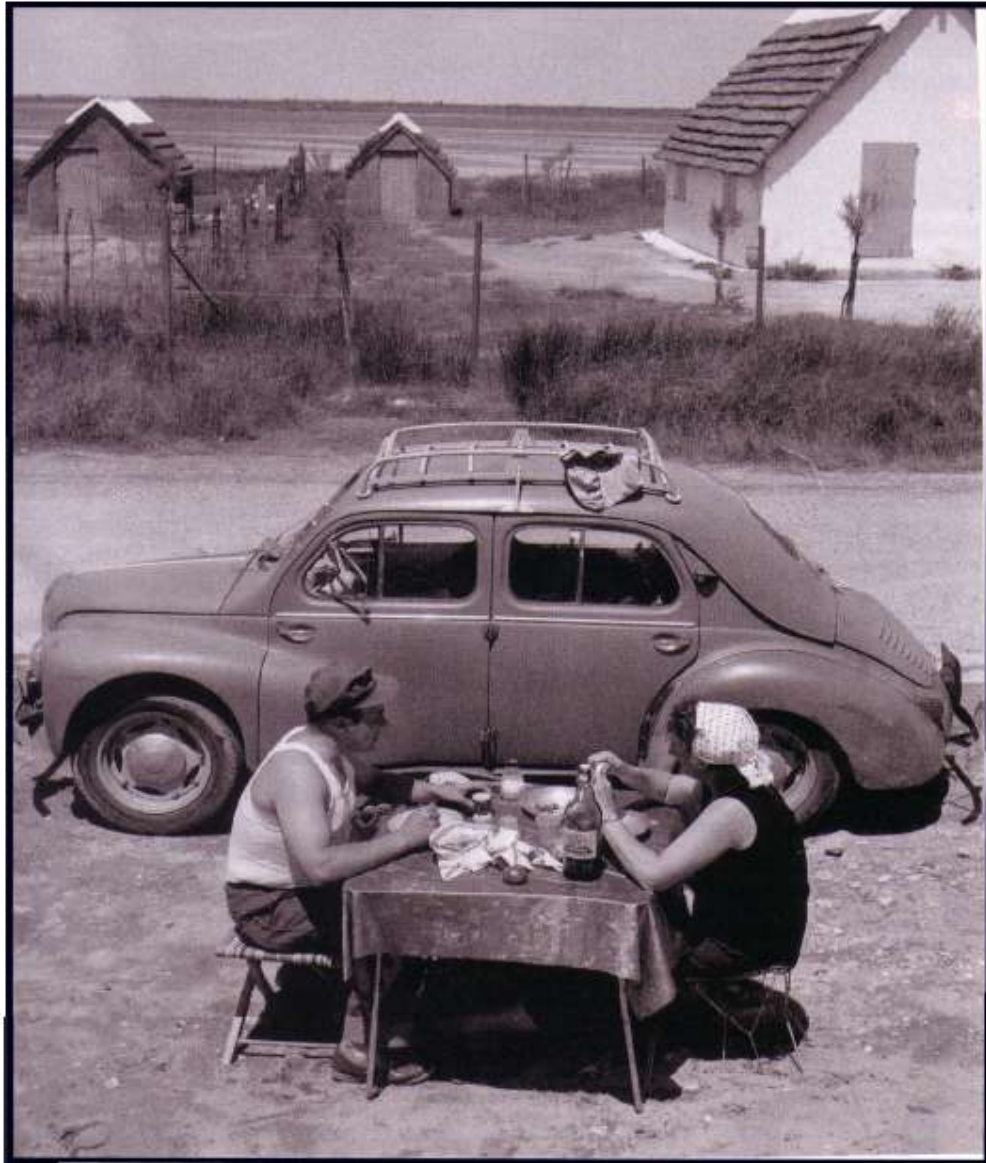
En Vacances. Été 1956.

Cinquante ans plus tard, comment les vacances ont-elles changé, et pourquoi? (75 mots environ)